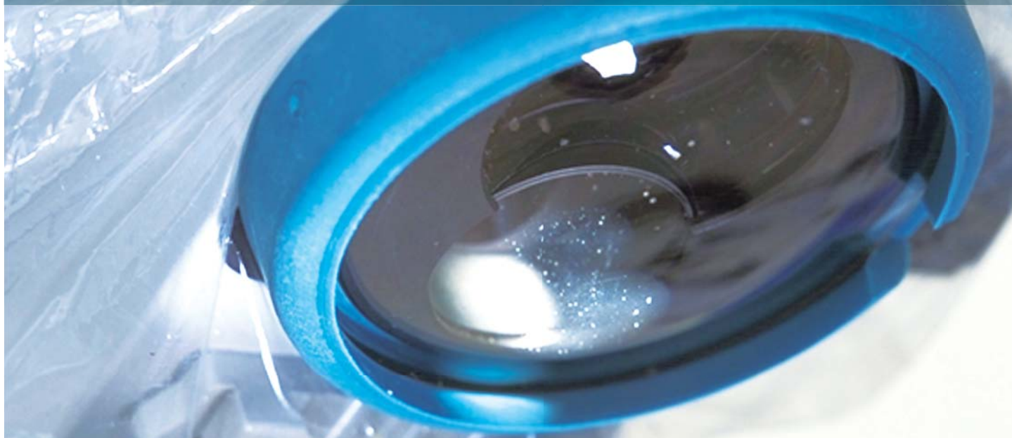
INDEPENDENT TEST RESULTS AFTER STERILIZATION