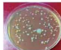
市販 サージカルマスク

※ 30分間着用した各マスクの表面をふき取りプレートを作製し、37℃で48時間培養。