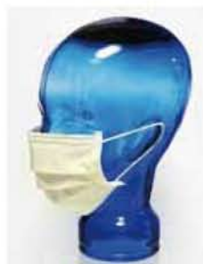
ヨウ素による薄い黄色