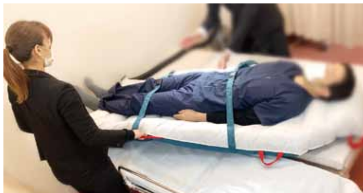
▲ ベッドからストレッチャーへの移乗