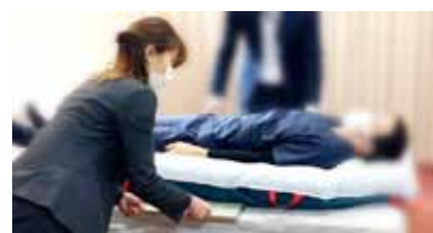
▲ X線カセットの挿入