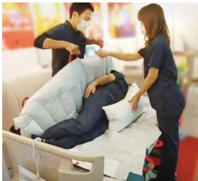
▲ 仰臥位から腹臥位への体位変換