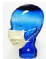
ヨウ素による薄み・黄色