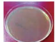
TrioMed アクティブサージカルマスク