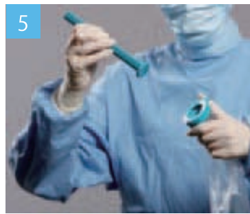
清潔な看護師が突起部分を押し、ロックを解除し、スティックを外して取り除きます。