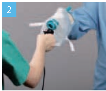
清潔な看護師がスティックをつかんだ状態で、外回り看護師がカバーを取り付けます。