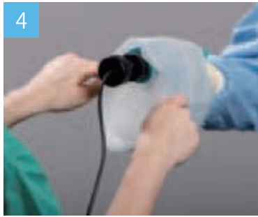
外回り看護師がドレープのつまみを引き、カメラとケーブルにドレープを被せます。