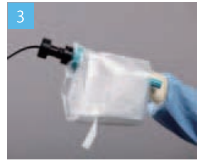
カメラのアタッチメントにしっかり接続されていることを入念に確かめます。