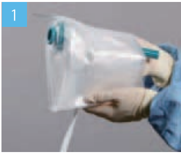
清潔な看護師がドレープの中に手を入れスティックをつかみます。