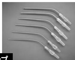
サクシオンチップ