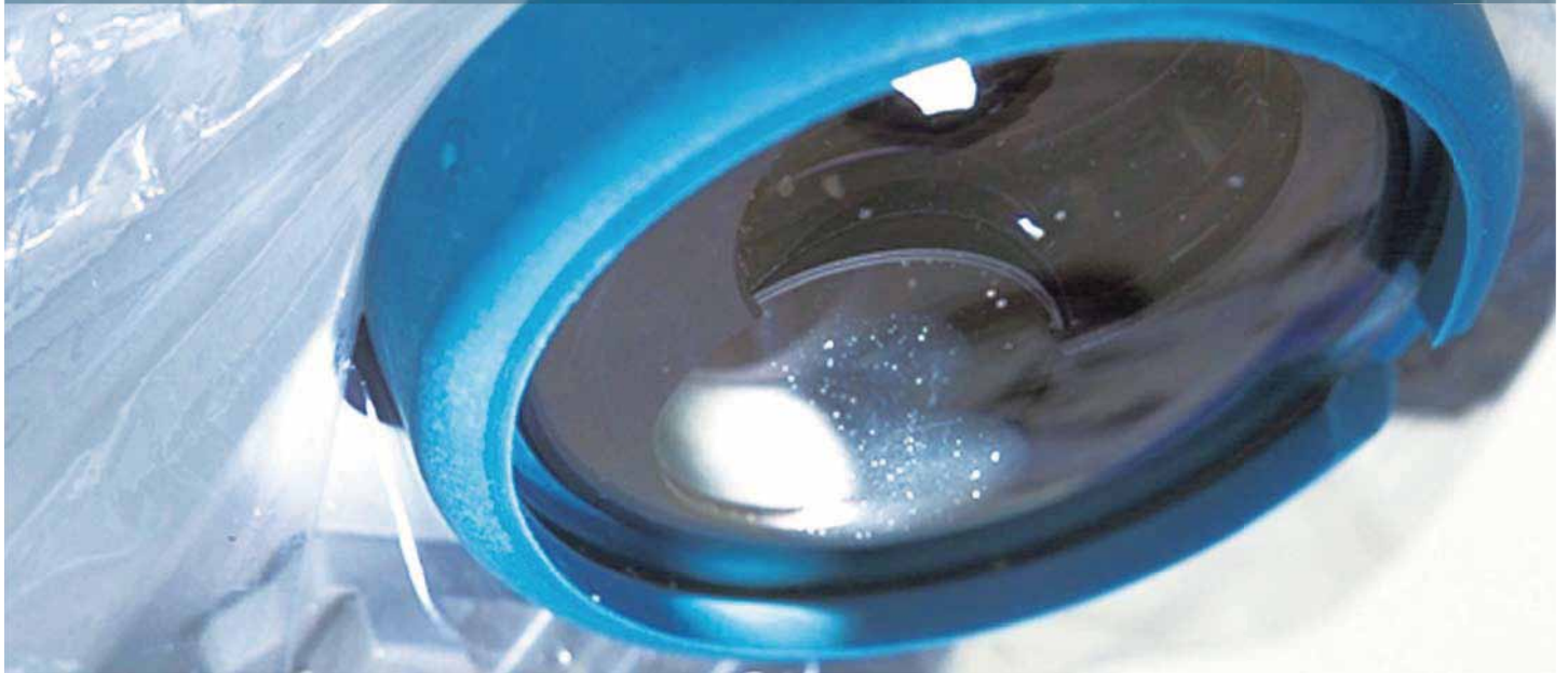
INDEPENDENT TEST RESULTS AFTER STERILIZATION